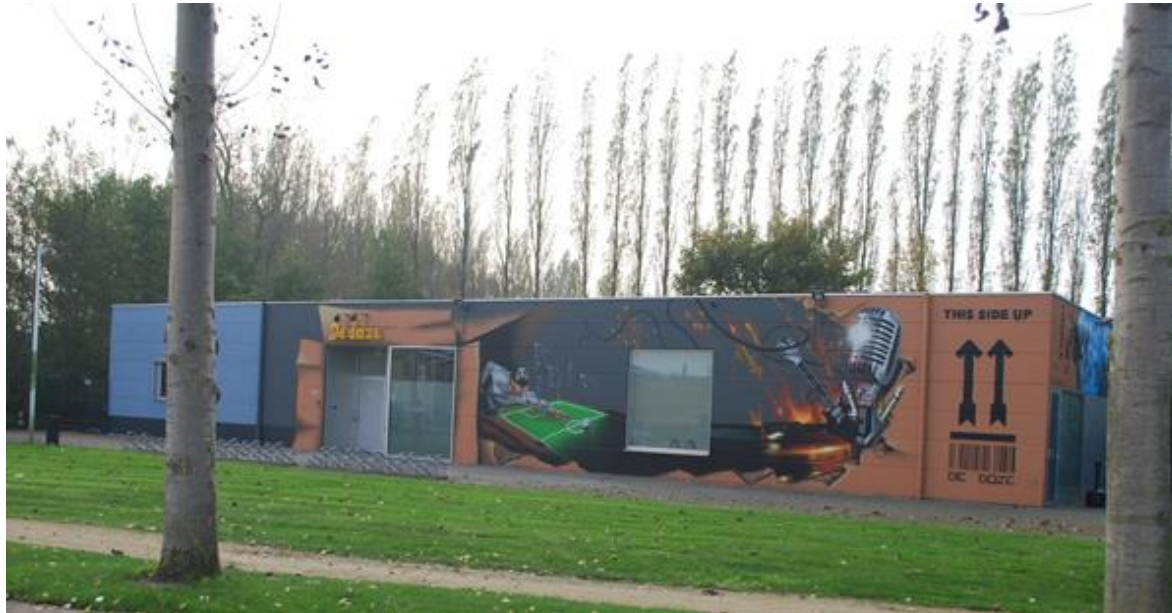
Jeugdhuis De Doze @ Noordstraat 140, Veurne