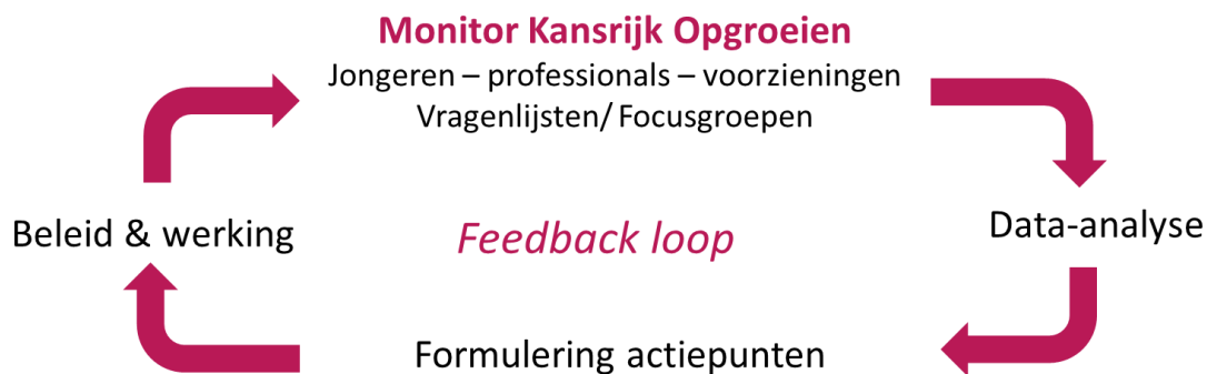
Figuur 2. Feedback loop

De monitor geeft echter geen waarheid, het gaat eerder over een sjabloon dat we op de werkelijkheid leggen om in te schatten hoe het met de jongeren gaat op mentaal vlak en wat hun zorgnoden zijn. We gaan aan de hand van dit beeld aan de slag met mogelijke verklaringen als ook met het identificeren van mogelijke verbeterpunten en goede praktijken. Op basis van deze uitkomsten kunnen zowel op niveau van de Vlaamse jeugdhulp als ook op het niveau van type voorziening actiepunten geformuleerd worden. Er zal geen data verzameld worden op niveau van de individuele voorzieningen, ter voorkoming van evaluatief karakter.